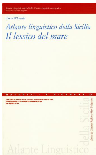
ATLANTE LINGUISTICO DELLA SICILIA CARTA 44

398. Ghiozzo paganello ( Gobius Paganellus )