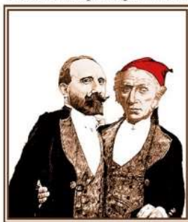
Catania 2-3 dicembre 2021 Dipartimento di Scienze Umanistiche (DISUM) Monastero dei Benedettini (Auditorium "Giancarlo De Carlo")